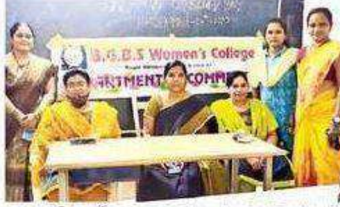
సమావేశంలో మాట్లాడుతున్న ప్రీన్సిపల్ అమ్మాజీ